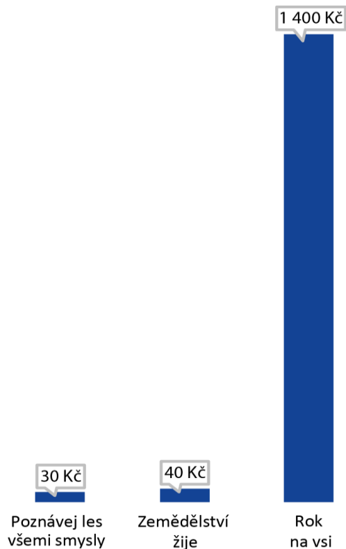
Graf č. 2 – Náklady na jednoho účastníka akce