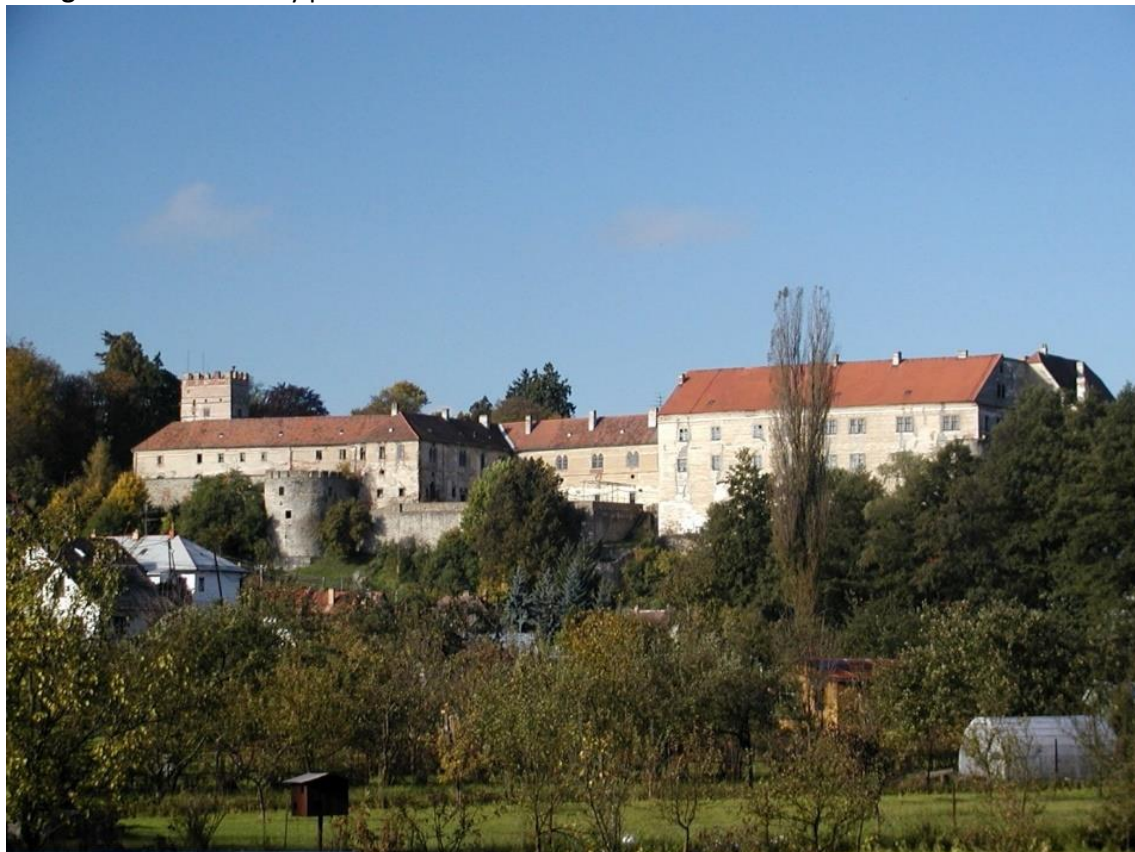
Fotografie č. 10: Celkový pohled na zámek Brtnice

Obnova zámku Brtnice započala v roce 2010. Během sedmi let realizace byly zrekonstruovány střechy a komíny na I. a II. nádvoří zámku. Současný vlastník nepokračuje v obnově zámku financované z Programu záchrany.