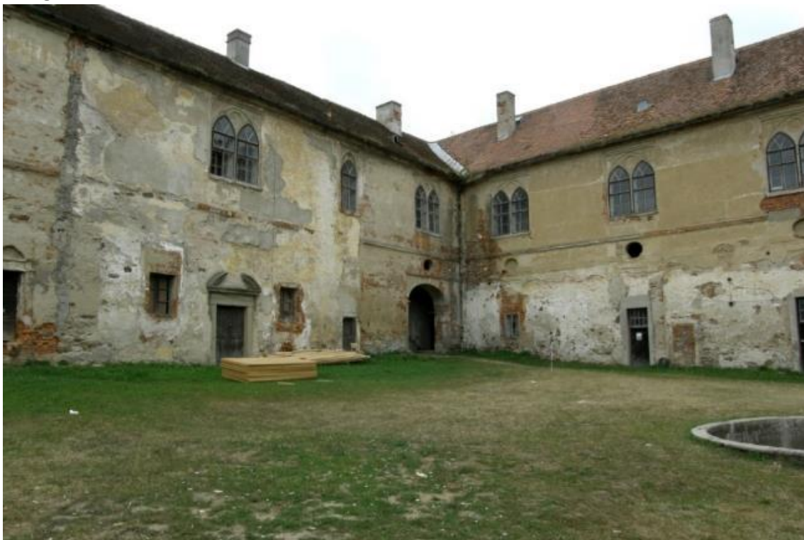
Fotografie č. 12: Neobnovená část zámku