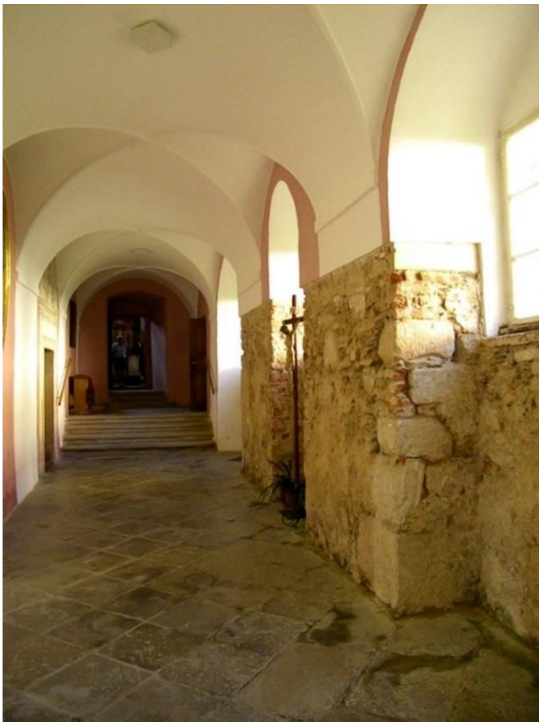
Fotografie č. 3: Neobnovená část areálu kláštera (obnova kamenné dlažby)