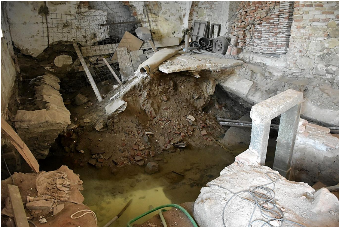
Fotografie č. 6: Neobnovená vnitřní část zámku