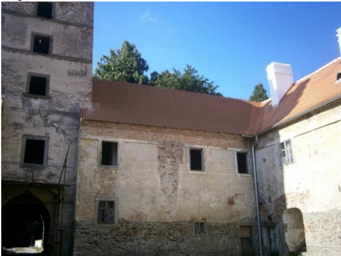
Fotografie č. 11: Obnovená část střech a komínů