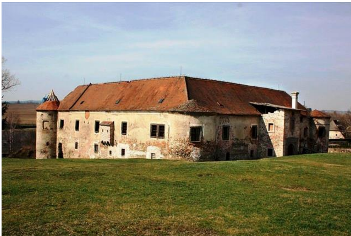
Fotografie č. 4: Celkový pohled na zámek Stránecká Zhoř

Renesanční zámek Stránecká Zhoř byl před započítím obnovy ve zdevastovaném stavu a podlehl by demolici. V rámci Programu záchrany je realizován rozsah prací, který vede k záchraně a postupné obnově historických prvků do původního stavu. Celková koncepce obnovy zámku přihlížející k dodržování tradičních materiálů a technologií a výsledky dosavadní stavební obnovy zámku byly prezentovány při mezinárodním kongresu v Londýně. Obnova zámku Stránecká Zhoř započala v roce 2000.