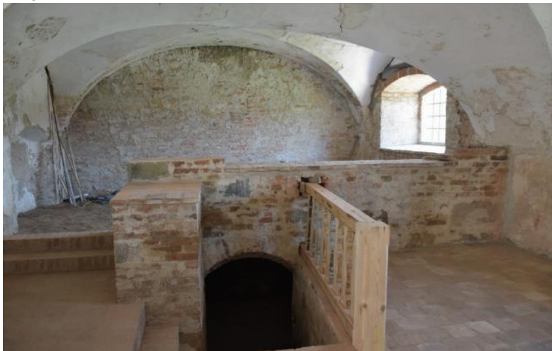
Fotografie č. 5: Obnovená vnitřní část zámku