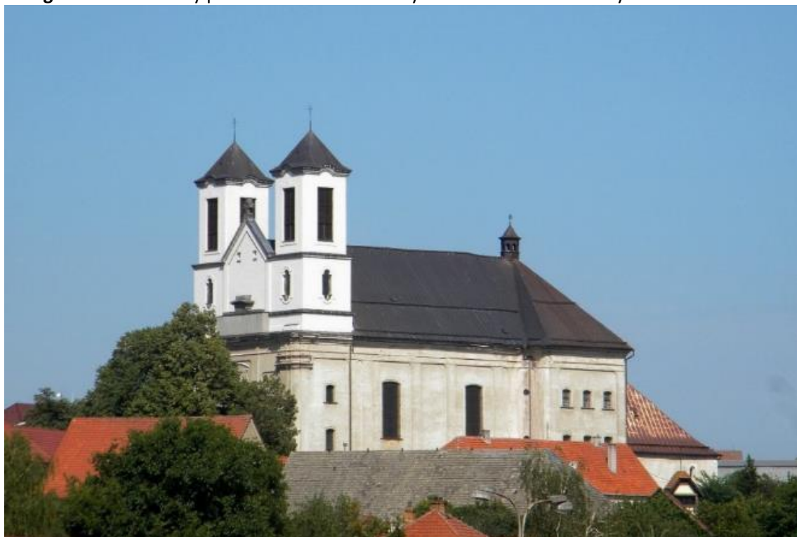
Fotografie č. 7: Celkový pohled na kostel sv. Anny a kostel Narození Panny Marie

Obnova kostela sv. Anny a kostela Narození Panny Marie v Přibyslavicích započala v roce 2011.