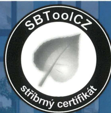
Schéma SBToolCZ: ADMINISTRATIVNÍ BUDOVY HODNOCENÍ VE FÁZI NÁVRHU